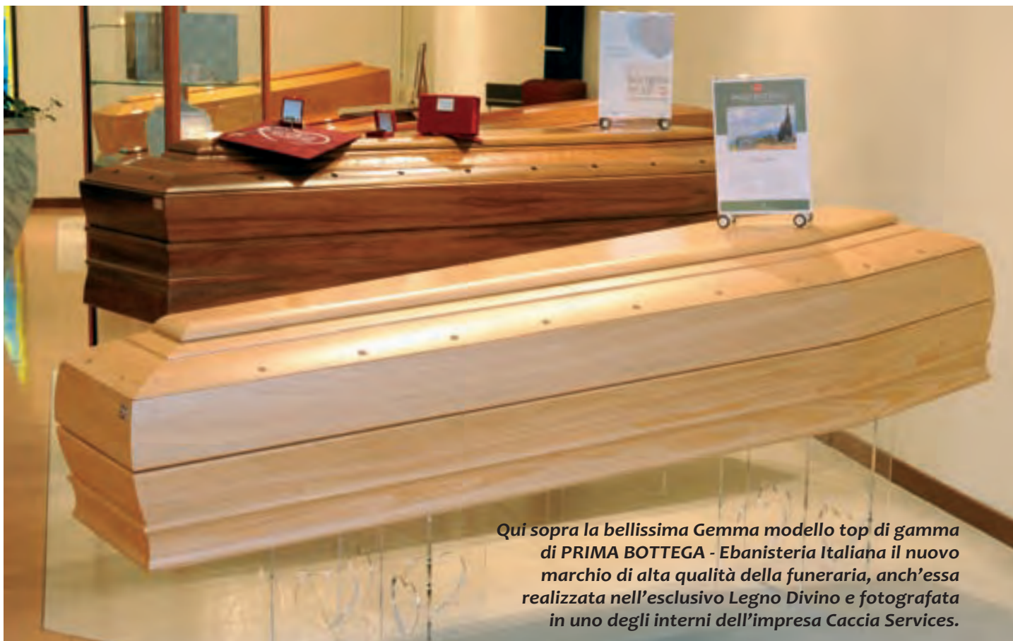
Qui sopra la bellissima Gemma modello top di gamma di PRIMA BOTTEGA - Ebanisteria Italiana il nuovo marchio di alta qualità della funeraria, anch'essa realizzata nell'esclusivo Legno Divino e fotografata in uno degli interni dell'impresa Caccia Services.