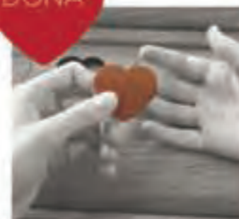
un gesto d'amore